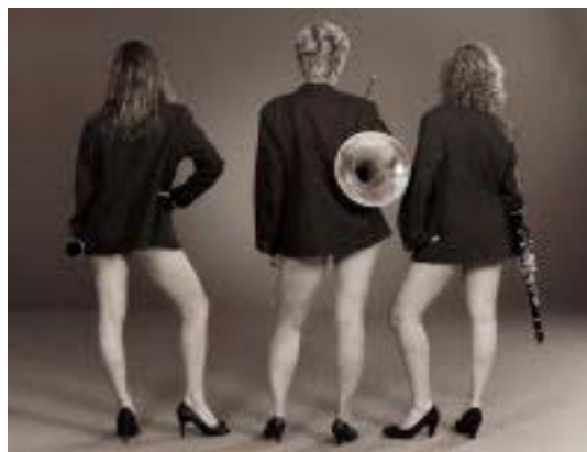
Arti PUUR Kalender – Kaskraker!