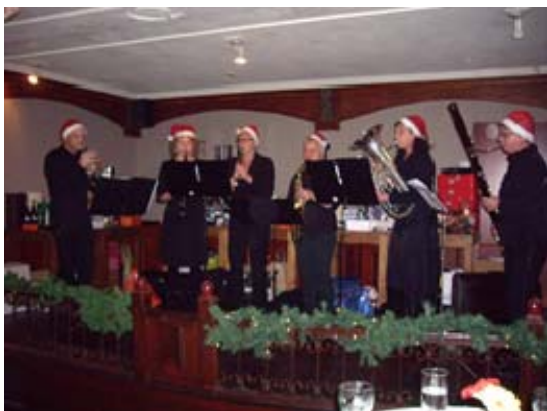
Arti Kerstensemble speelt bij Delicia in Tilburg